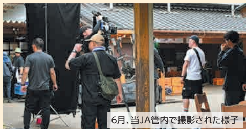
6月、当JA管内で撮影された様子

当JAの甘藷の取り組みや「行方かんしょ」がテーマとなったドラマ、夜ドラ「コトコト～おいしい心と出会う旅～」茨城編が、NHK総合テレビにて放送されます。ぜひお見逃しなく!