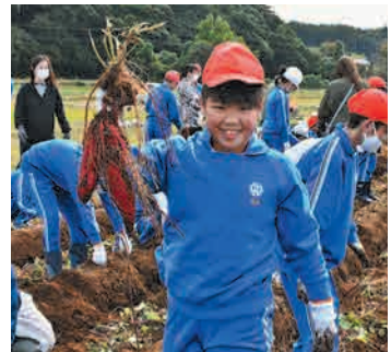
11/14 鹿嶋市立波野小学校