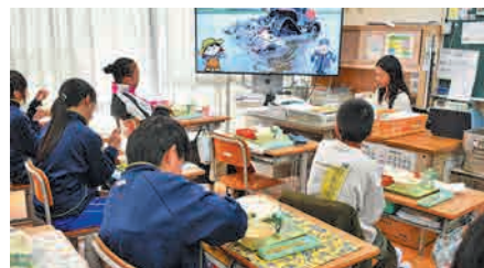
動画を見ながら給食を楽しむ児童(行方市立麻生小学校)

11月21日は、「JAなめがたしおさいの日」と題し、行方市の小学校で、当JAが提供する米や野菜を使った学校給食が実施されました。給食の時間には「JAなめがたしおさいの美味しいお米ができるまで」を紹介するYouTube動画も視聴し、児童たちは日々口にするお米がどのように育ち、収穫され、食卓へ届くのかを学びました。食への感謝や地域農業への理解を深める貴重な機会となりました。