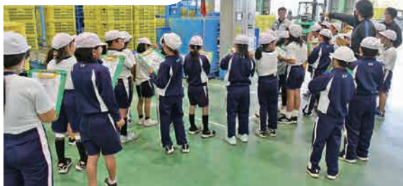
JA職員の説明を熱心に聞く児童たち