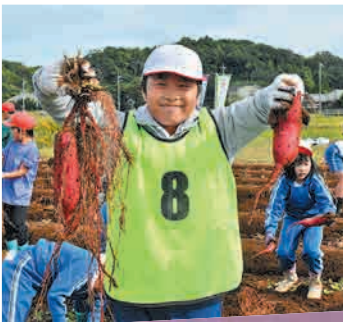
10/29 鹿嶋市立大同西小学校

5月と6月に苗植えたさつまいもを、自分たちの手で収穫しました。児童たちは元気に芋掘りを楽しみました。