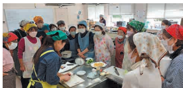
講師の実演を見ながら調理ポイントを学びました