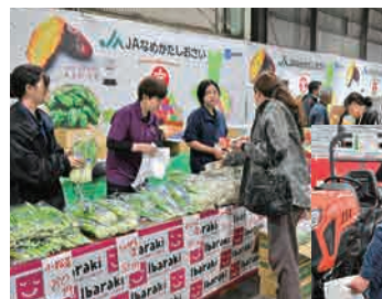
◀ 展示会場に並ぶ新鮮野菜

10月10日と11日に、須田資材センターで秋の農機具大展示即売会を開き、約400名が来場しました。トラクターや肥料散布機、土壌消毒機などの農業関連機械を展示。農業資材即売会では、時期に合わせた商品をピックアップし、生産資材を特別価格で販売しました。また、農業融資や共済の相談コーナー、地元新鮮野菜と焼き芋の販売なども行い、会場は大変賑わいました。