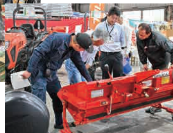
▶ 農業機関の説明を受ける来場者