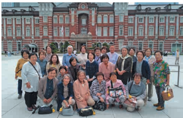
東京駅丸の内駅舎で記念撮影

玉造支部女性部は10月7日、東京方面（豊洲市場・皇居散策）と道の駅常総へ日帰り研修を行いました。豊洲市場と道の駅常総を視察し、流通販売の取り組みについて学びました。特に道の駅常総では、地域特産品を中心とした販売や季節イベントの実施など、観光資源として地域活性化に貢献している様子を実感でき、参加者は楽しみながら有意義な時間を過ごしました。