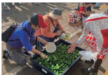
ピーマン・ミニトマトすくいをする来場者