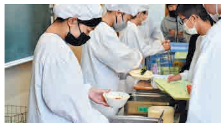
給食を配膳する様子