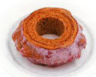
カリッとハードタイプ ¥2,300(税込)