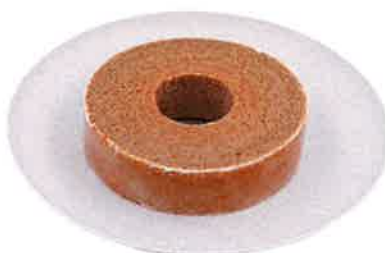
ふわふわソフトタイプ ¥1,680(税込)

新オープンの「NAMEGATA米こbaumクーヘン(行方市玉造甲)」とコラボし、店頭にて販売開始しました。