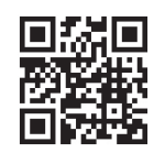
茨城の子ども食堂情報に関してはこちら

主に市民のボランティアが主体となり、無料または低価格帯で子どもたちに食事を提供する、地域に密着したコミュニティの場です。